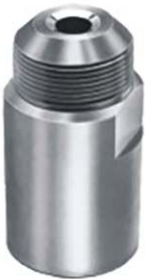
墙上安装, 一体式(内)