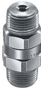
墙上安装, 可拆卸帽式(外)