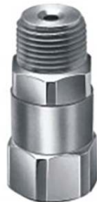
墙上安装, 可拆卸帽式(内)